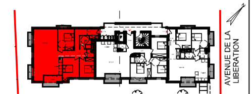
PLAN R+1 - BATIMENT A