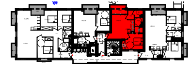
PLAN R+1 - BATIMENT B